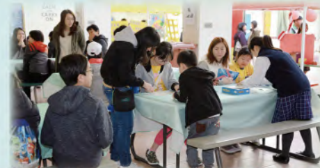
輔導組也安排家長和同學們在操場玩桌上遊戲。

輔導組在有蓋操場內為參觀家長及同學們提供免費手工咖啡。濃郁的咖啡香味瀰漫著整個校園，令人精神為之一振。