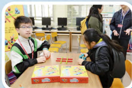
同學正在玩「奇雞連連」遊戲

電腦科為同學設計了不同的電腦遊戲。在眾多的遊戲中，最有趣、最令人深刻的遊戲就是「奇雞連連」，光聽名字就覺得很有趣呢！同學們要運用隨機應變的能力，將對方的「公雞」吃掉。這看似非常簡單，但其實也需要不少的技巧呢！